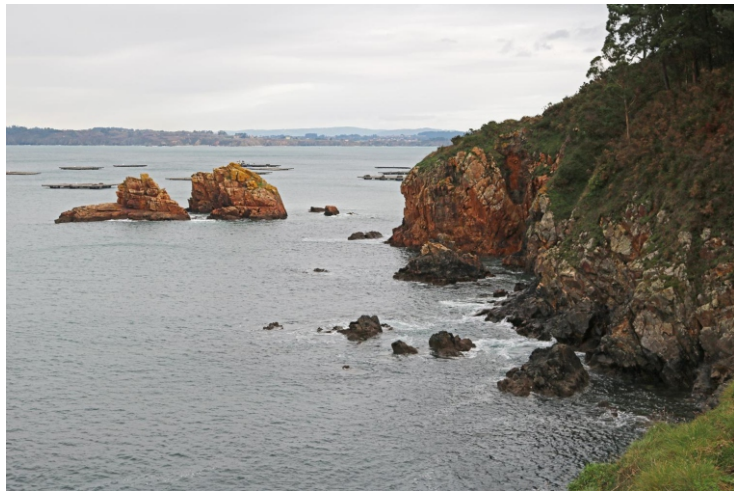
O Gaivoteiro. Punta Gaivoteiro.