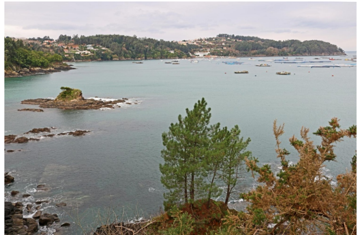
Enseada do Cirro e Pena da Herba