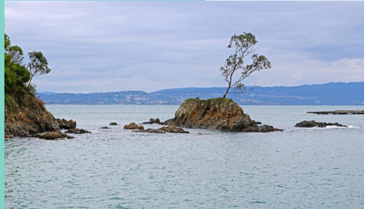
Punta de Lourido