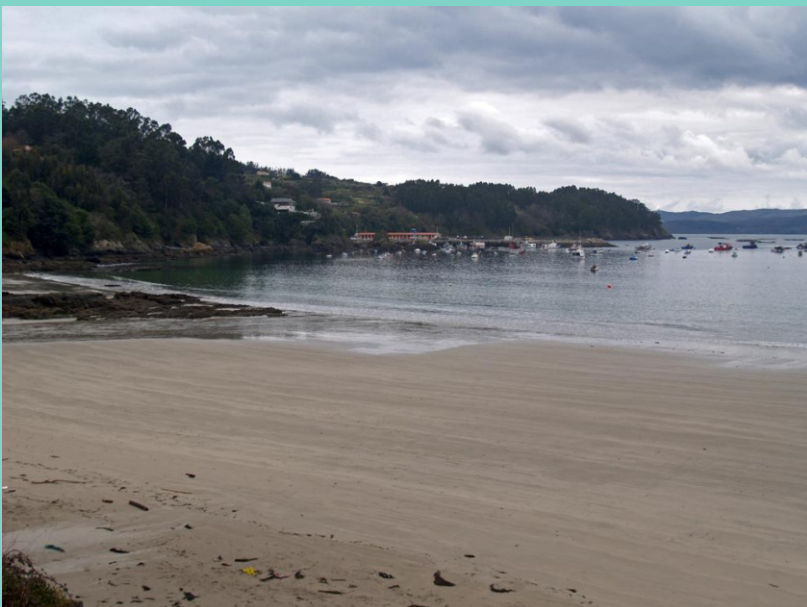
Praias de Cirro (Area Grande e Areal do Mar da Grande)

Un roteiro para descubrir a parte menos amable da Costa Doce, o litoral do concello de Sada no que as rochas son o elemento dominante e forman unha parede continua, de cantís que nalgúns puntos superan os 50 m de altura, con incontables entrantes e saíntes e case ningún punto de acceso doado ao mar; un tramo de costa no que para acceder ás praias, das que as máis quedan mergulladas coa marea alta, hai que baixar escaleiras de máis de 70 chanzos, pero tamén é un litoral que conserva a imaxe do natural, no que aínda que a parte utilizable do terreo está ocupado por piñeiros e eucaliptos a vertical, inaccesible, está cuberta de loureiros e rebolos que medran e resisten, apegándose ás pedras e adaptando a súa forma á do cantil, no ambiente extremo que lles crea a exposición ao sol e a falta de auga.