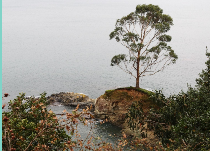
Pena da Herba