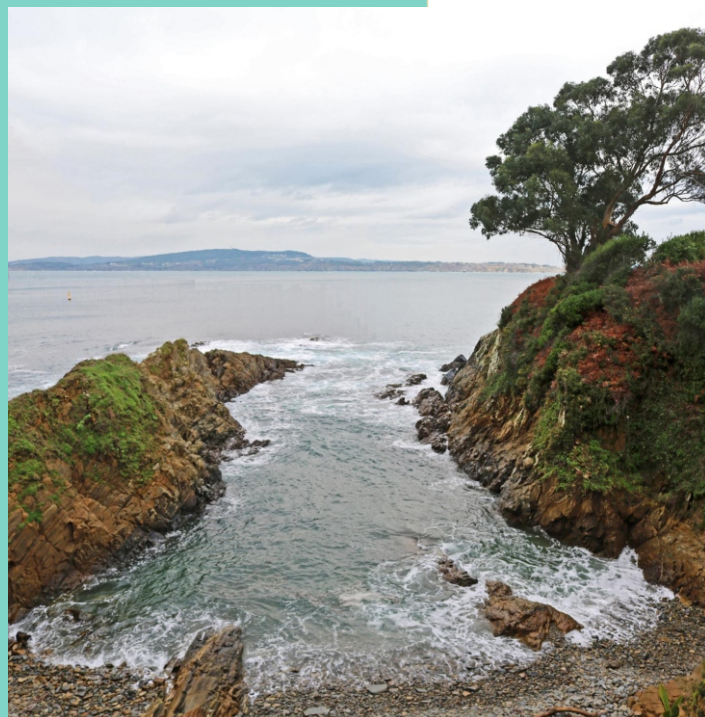
Unha das pequenas entradas con coídos, na punta de San Mamede,