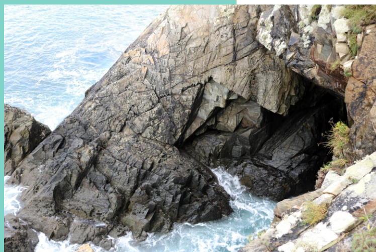
A punta de San Mamede, na que se localizan os restos dun castro da idade de ferro, é un interesante punto panorámico sobre a ría de Ares, nunha contorna de abruptos e elevados cantís con furnas, ensedas, illotes coroados de vexetación e pequenos coídos.