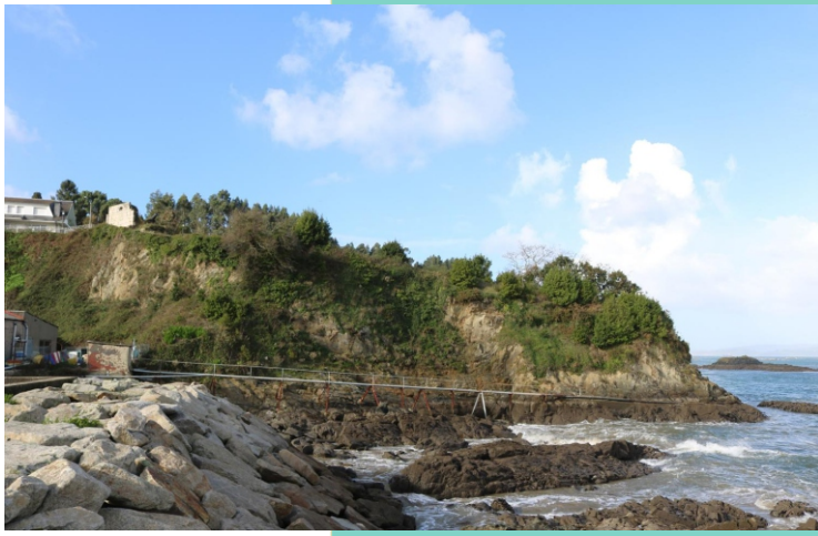
Punta de Fontán e castelo