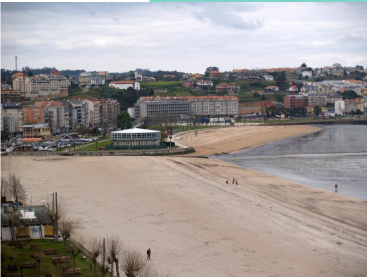
Praias de Sada (A Nova e As Delicias, separadas polo rego de Fontoira)