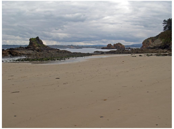
Praia de San Pedro e Pena da Herba