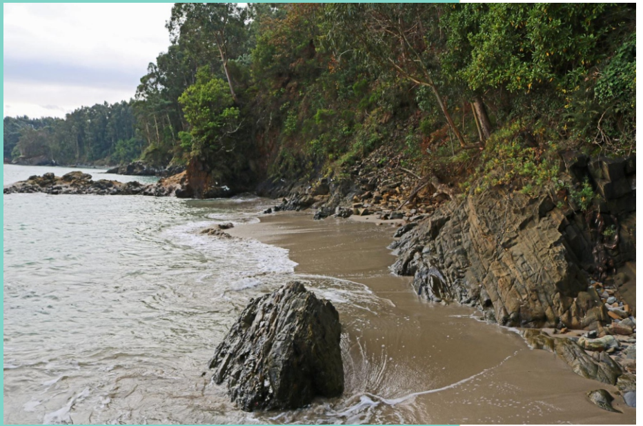
Praia de Lobos