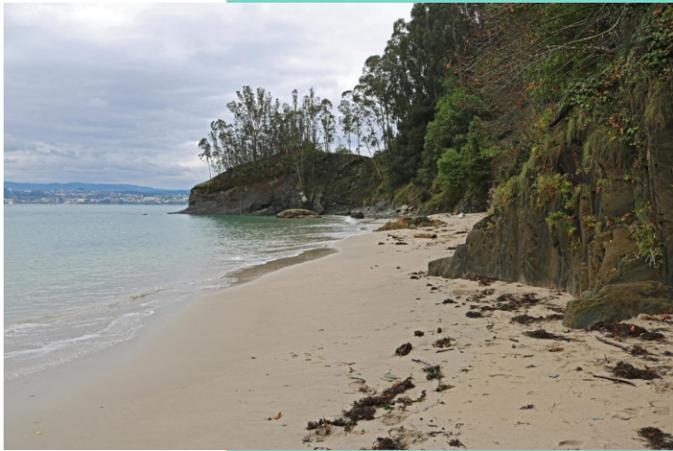
Praia e punta Arnela