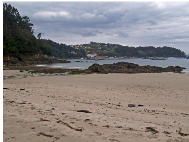
Praia de San Pedro e Punta do Castelo