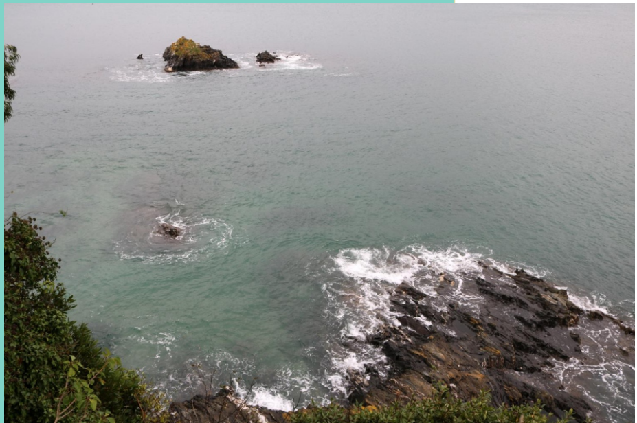
Pena da Herba