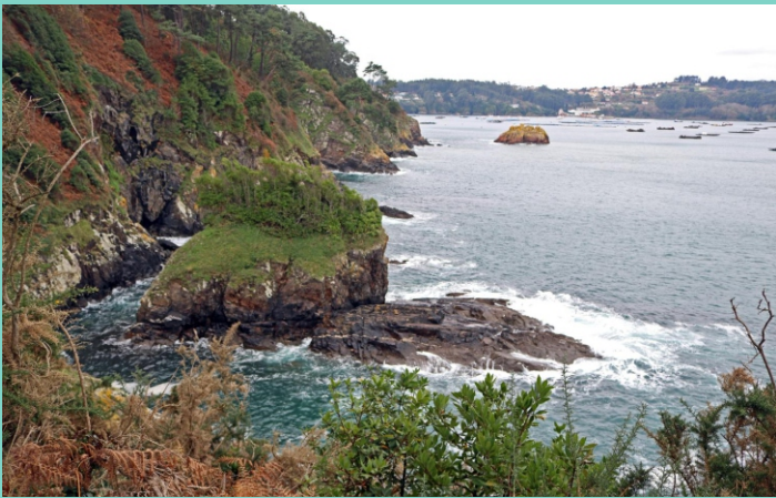
Furna da Xarda

O percorrido é máis longo do que aparenta porque os entrantes e saíntes da liña de costa aumentan a distancia e as continuas subidas e baixadas fan que tardemos máis do que nun comezo agardabamos.